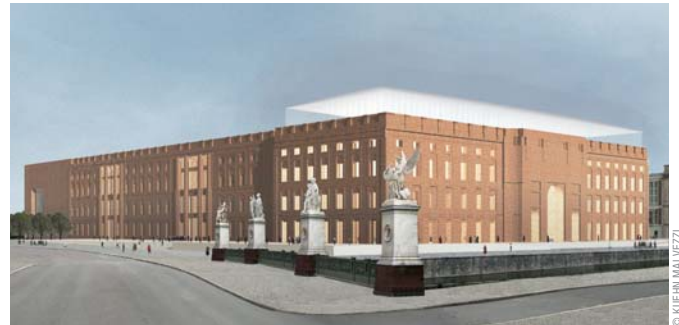
Entwurf Kuehn Malvezzi

4 Stellen Sie aus den bisher gefundenen Unterlagen und Ergebnissen der Recherche und Auswertung ein übersichtliches Material für die Vorbereitung auf die Podiumsdiskussion zusammen. Legen Sie dabei einen Schwerpunkt auf einzelne konkrete Fragen, die diskutiert werden: Kuppel, Lösung auf der Spreeseite, Nutzungsvarianten etc. Formulieren Sie ein persönliches Statement: Wie sehen Sie nach Sichtung und Würdigung vieler Aspekte das Schlossprojekt – Was spricht aus Ihrer Sicht dafür – was dagegen? Welche Fragen bleiben offen?