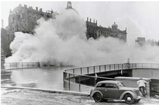
Sprengung des Berliner Schlosses 1950

Arbeits-/Umsetzungshinweise Das Projekt ist über einen längeren Zeitraum von der gesamten Lerngruppe zu planen, ggf. fach- und kursübergreifend (z.B. Geschichte/Politik, Kunst, Mathematik). Drei bis vier Projektteams sollten sich die einzelnen Arbeitsschritte/Aufgaben selbstständig aufteilen, ggf. anreichern, differenzieren, akzentuieren. Dabei sind Recherche und Textarbeit sowie vielfältige mündliche und schriftliche Kommunikations- und Argumentationsformen zu nutzen. Ziel sind Vorbereitung, Durchführung, Auswertung einer Podiumsdiskussion zum Thema in der Schulöffentlichkeit. Das gesamte Projekt sollte – wo möglich – von Experten begleitet und unterstützt werden.