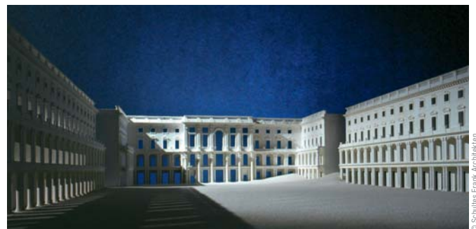
Entwurf Axel Schultes Charlotte Frank