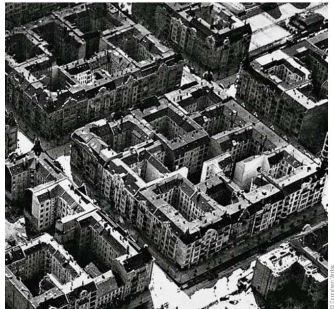
Mietskasernen um 1900