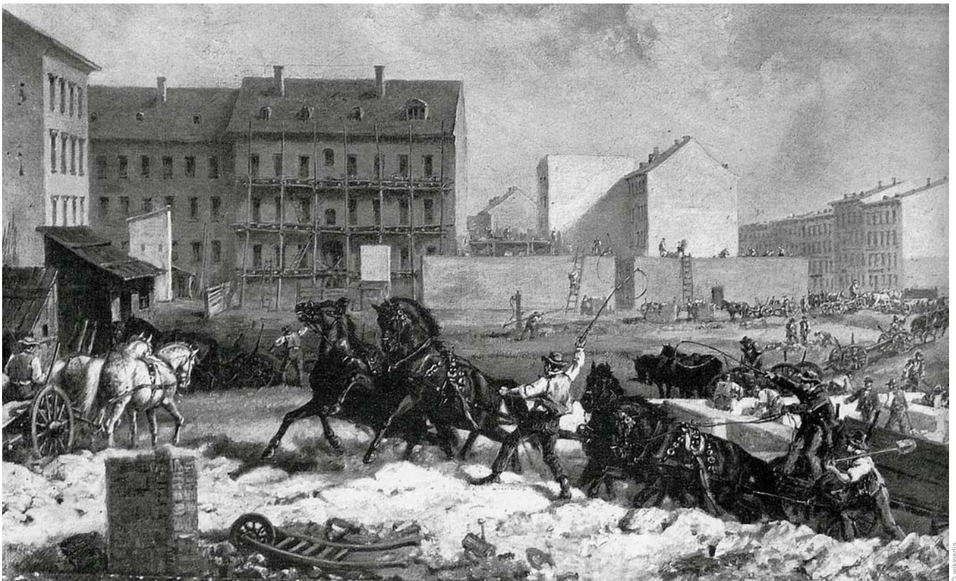
Tempo der Gründerzeit (Berlin 1875, Bau der Grenadierstraße, heute Altstadtstraße)

Arbeits-/Umsetzungshinweise Dieses Projekt umfasst zwei bis drei Unterrichtsstunden in arbeitsteiligen Gruppen und mündet in einer gemeinsamen Präsentation der Ergebnisse. Die einzelnen Gruppen können jeweils einen Baukasten geschlossen bearbeiten oder sich durch eine gezielte Auswahl aus den Baukästen 1 bis 4 einen eigenen Baukasten zusammenstellen. Dafür ist eine Absprache zwischen den einzelnen Gruppen erforderlich.