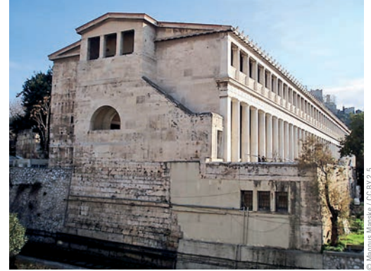
Heiligtümer / Feste: 1 Zwölf-Götter-Altar / 2 Bouleuterion / 3 Stoa des Zeus Eleutherios Gerichte: 4 Stoa Basileios (Königshalle) / 5 Süd-Hof / 6 Heliäa Verwaltung: 7 Tholos / Handel: 8 Attalos-Stoa