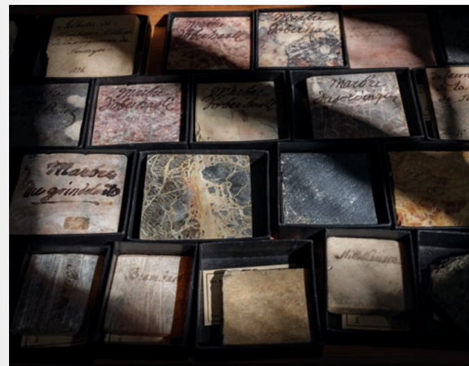
Buntmarmore aus Goethes geologischer Sammlung